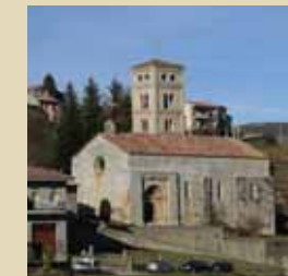
El temple romànic de Santa Cecília de Molló

Espinavell hi havia un parell o tres de masies separades. Vaig dir al meu ajudant: