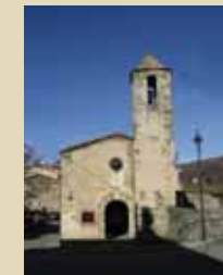
Capella de Sant Sebastià de Molló

Alguns refugiats, quan arribaren a Prats de Molló, com que feia molt fred, varen cercar abrigit en algunes cabanes improvisades amb branques i roba.